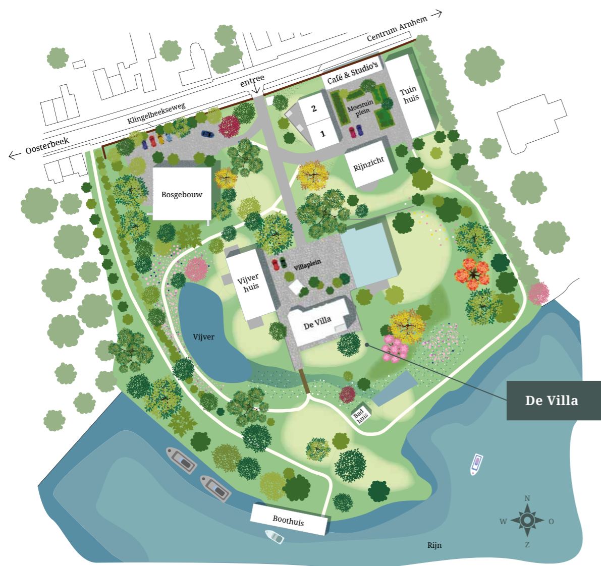
De Villa op Landgoed Klingelbeek

Het penthouse beschikt over één parkeerplaats op het Villaplein. In overleg is het mogelijk om één extra parkeerplaats te kopen welke is gelegen onder in de parkeerkelder van het Bosgebouw.