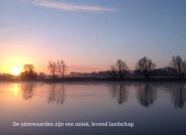
De uiterwaarden zijn een uniek, levend landschap