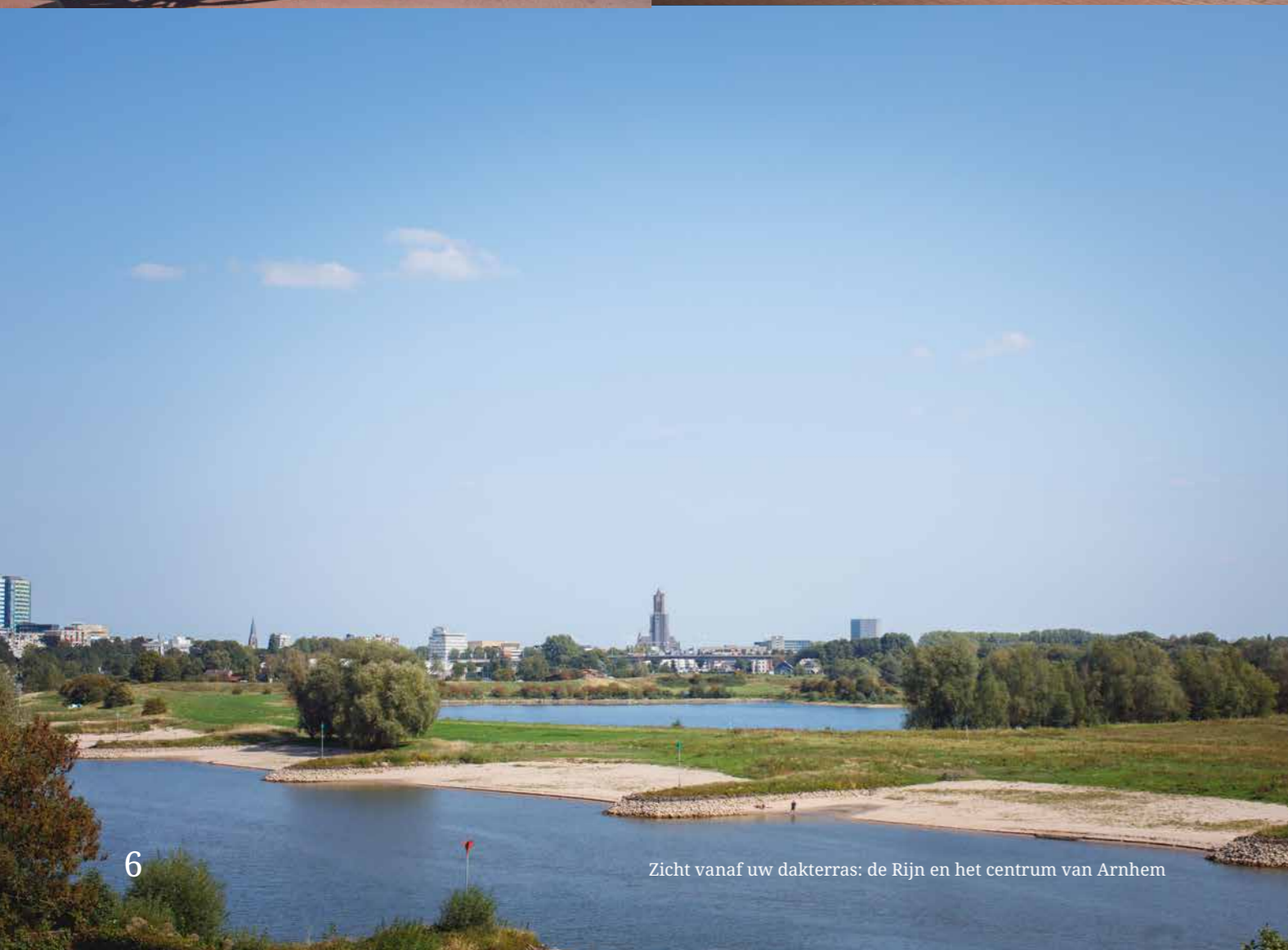
Zicht vanaf uw dakterras: de Rijn en het centrum van Arnhem