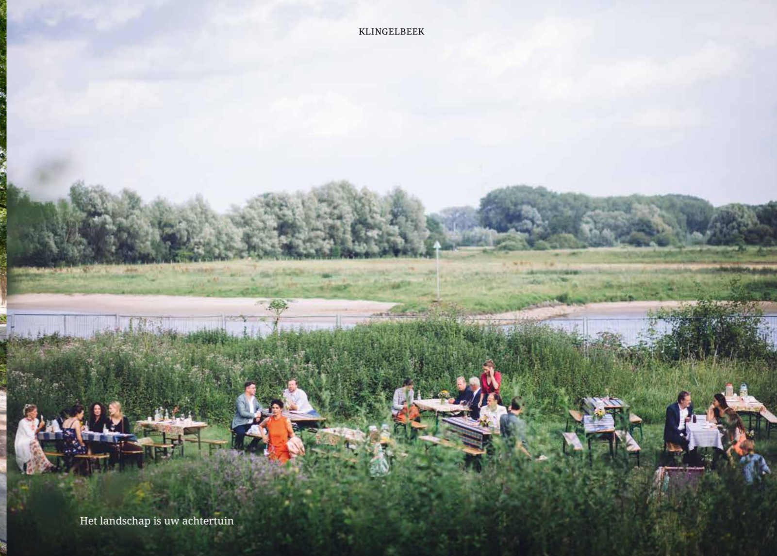
Het landschap is uw achtertuin