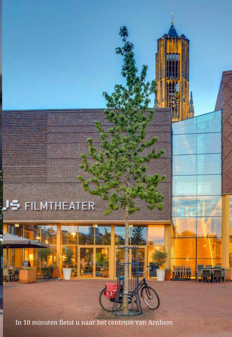
In 10 minuten fietst u naar het centrum van Arnhem